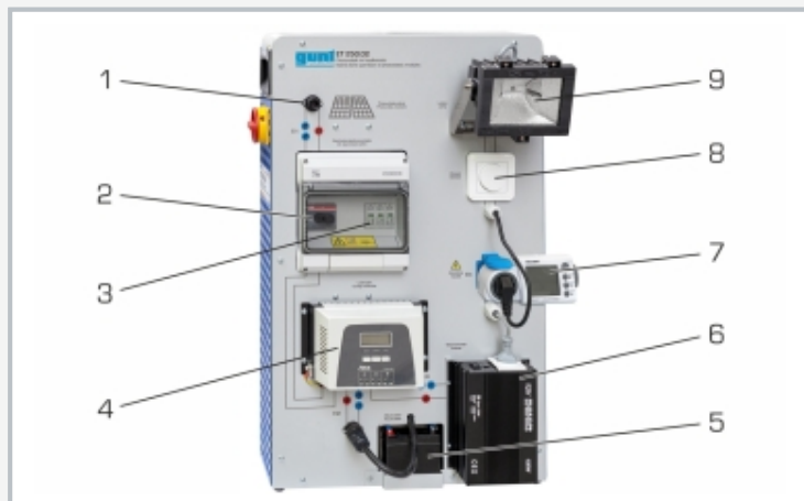
1 hembrilla para módulo fotovoltaico, 2 seccionador de corriente continua, 3 protección contra sobretensión, 4 regulador de carga, 5 acumulador, 6 inversor, 7 contador de energía, 8 atenuador de luz, 9 lámpara halógena